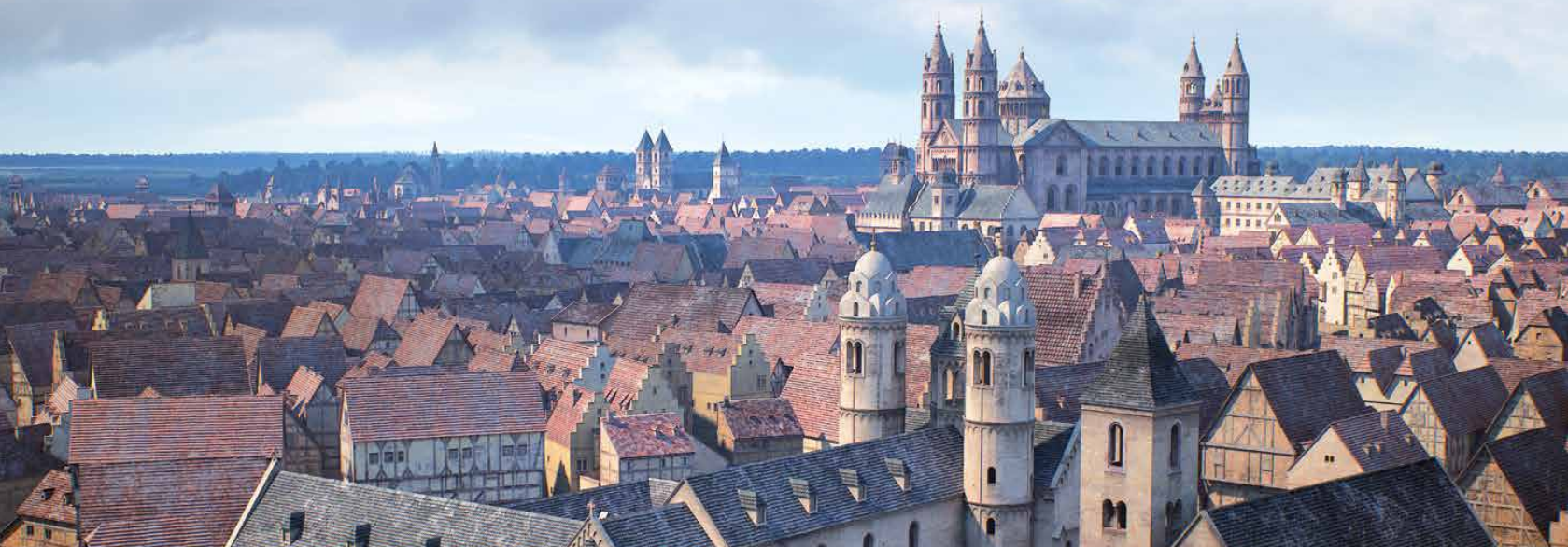
Worms um 1521 in 3D - Visualisierung durch FaberCourtial