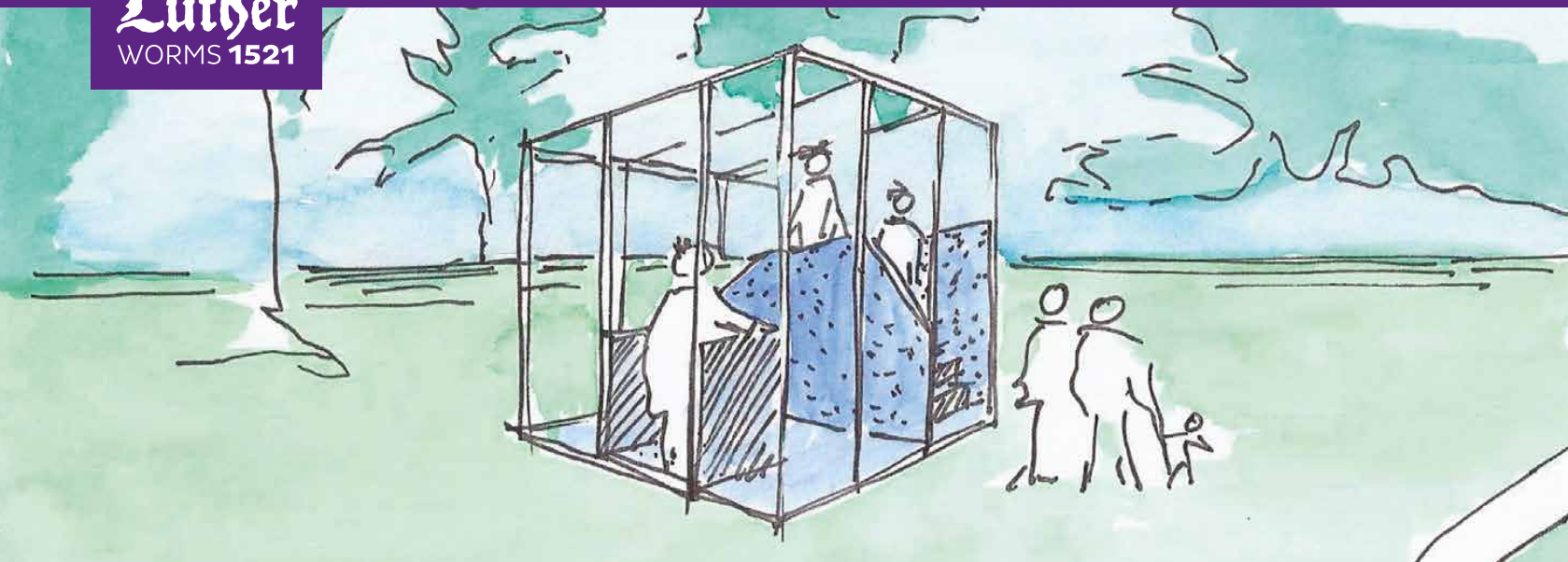
Die „Szene 1521“ - Visualisierung durch Illig&Illig