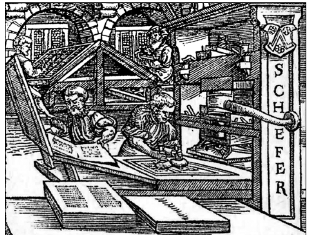
Abbildung: Die Schöffer-Werkstatt, Holzschnitt, 1548